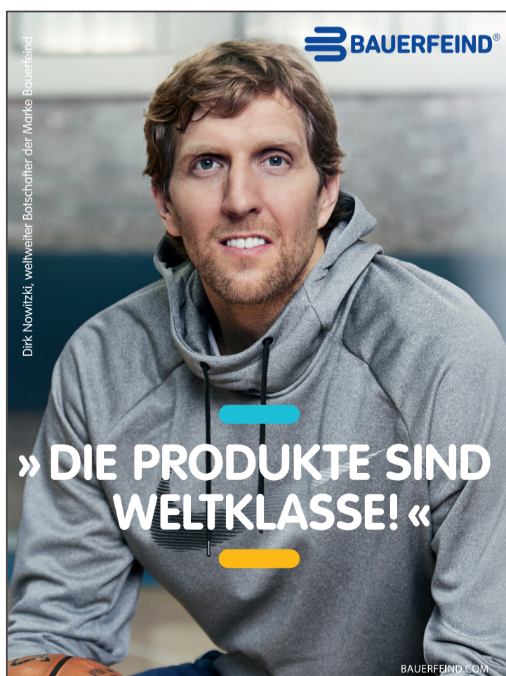
Dirk Nowitzki, weltweiter Botschafter der Marke Bauerfeind