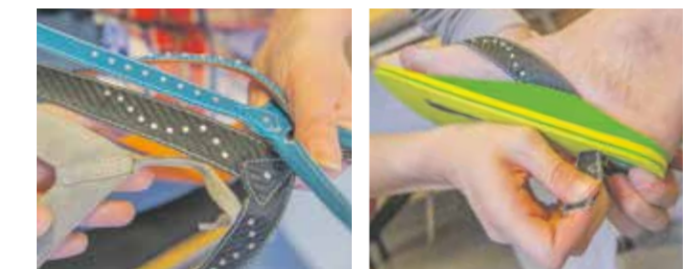
Die große Auswahl der Einlagen-Rohlinge in Kombination mit der Vielfalt der zur Verfügung stehenden Riemchen ist der Kreativität keine Grenze gesetzt.

ist irgendwann lästig... (lacht). Nein, Scherz beiseite. Einlagen kann man natürlich in nahezu jedem Schuh tragen. Aber bei einem Sommer wie im vergangenen Jahr sehnt man sich nach weniger Schuhwerk. Und da bietet das Sanitätshaus Sittler etwas ganz besonders witziges an. Mit den digitalen Daten meiner sensomotorischen Einlagen werden sozusagen Einlagen mit Sohle gefräst. Dann fehlt nur noch das Riemchen und fertig ist der orthopädisch wertvolle Flip-Flop für den Sommer!