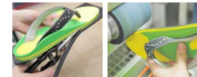
Der Flip-Flop wird mit einer 5mm starken, robusten Laufsohle ausgestattet. Die Größe wird definiert und der Fußform entsprechend individuell angepasst (rundes Bild ganz oben). Zum Schluß erledigt der Schleifbock die Feinarbeit und der Flip-Flop bekommt seine endgültige Kontur um seine Trägerin durch den Sommer zu begleiten.